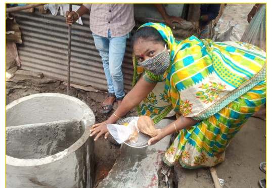
Families happy on receiving their own septic tank