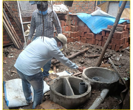
Installation of septic tanks for facilitation of individual toilets