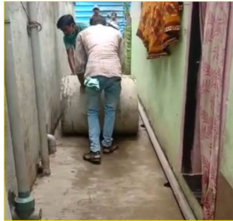
Getting septic tanks through narrow lanes at beneficiary doorstep